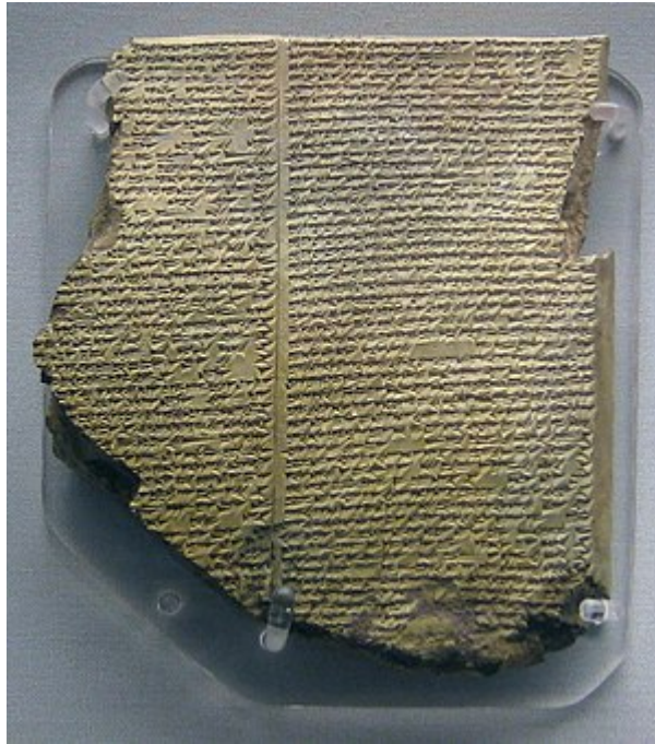
Աքադիան սալիկ , որի վրա հատված է Գիլգամեշի էպոսից

պատմության կարևորագույն դրվագները և այլ ազգային խորհրդանշանների ծագման կամ ընդունման պատմությունը: