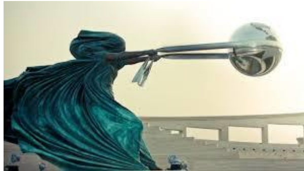
Լորենցո Քուինի «Բնության ուժը»

Բնության պահպանությունը մարդկության գլխավոր հիմնախնդիրն է: