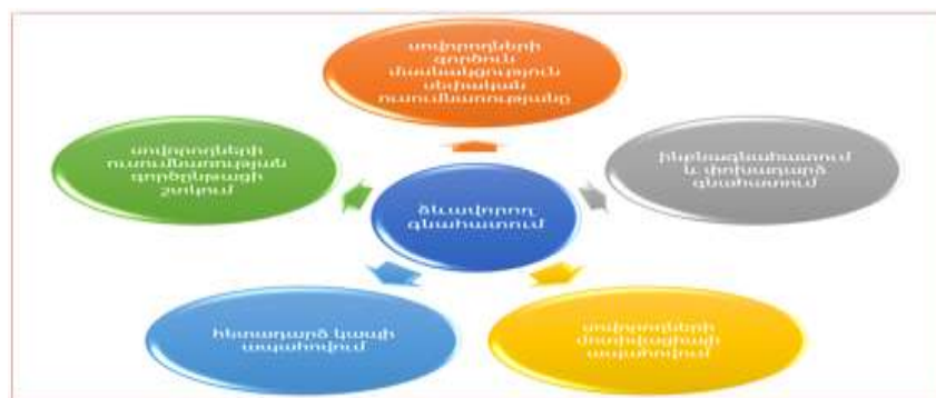
Նկար 4. «ՈՒՆԳ բաղադրիչները»