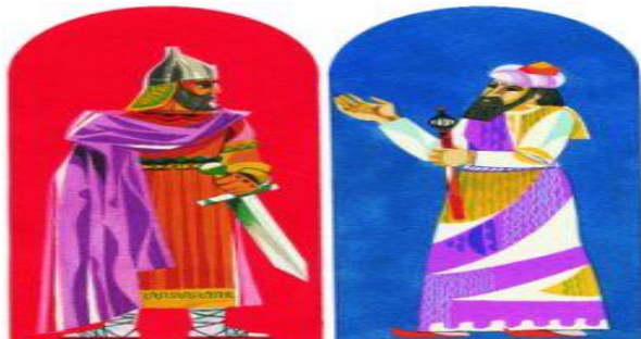
Նկարում՝ Արշակ և Շապուհ

Արժեքային համակարգի ձևավորում ՝ թեմային առնչվող բազմաթիվ գեղարվեստական գրականություն է հրատարակվել: Առավել տպավորիչ է Փավստոս Բուզանդի «Պատմություն Հայոց» երկից «Արշակ և Շապուհ» հատվածը, որի հիմնական գաղափարն այն է, որ մարդն իր հայրենիքում, իր հողի վրա է միայն ազատ, հպարտ ու համարձակ, ուստի սրբությամբ պետք է պահպանել հայրենի հողը 10 :