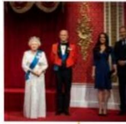
Museum of Madame Tussauds