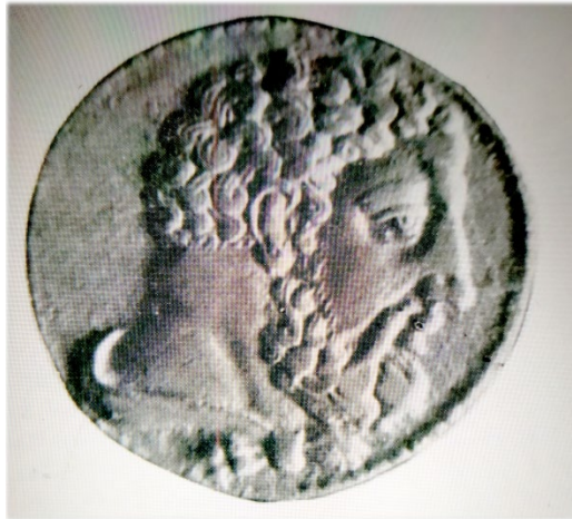
Դուցազնական Հերակլեսի պատկերը Հայաստանի փոխարքա Տիրիբազոսի դրամի վրա մթա 4-րդ դար

Հայաստանի սատրապ Օրոնտեսի դրամները հայտնի են ոսկյա,արծաթյա և պղնձյա օրինակներով: Դրամները թողարկվել են Ք.Ա. 362թ Լամպսակ, Կլագոմեն և այլ քաղաքներում: Դրանց թողարկումը պայմանավորված է տեղական պահանջով: Օրոնտեսի դրամի վրա պատկերված են հեթանոսական աստվածներ Ջևսի, Աթենասի պատկերները: Պատկերված են նաև արևի պաշտամունքին վերաբերող խորհրդանշաններ և աքեմենյան տիրակալների ու իրեն՝ Օրոնտեսի դիմանկարը: Ք.Ա. 362թ. Լամպսակում թողարկված դրամի մի կողմում Ջևսի կիսանդրին է, գանգրաիեր գլխով և մորուքով, դարձ երեսին՝ թևավոր ձի առջևի ոտքերով թռիչքի մեջ: