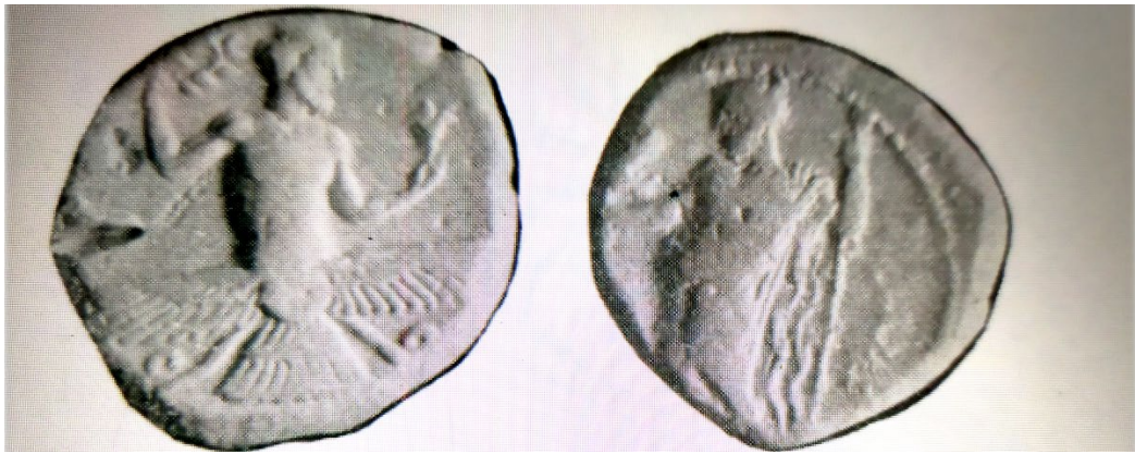
Հայաստանի Աքեմենյան փոխարքա Տիրիբազոսի արծաթյա դրամը մթա 4-րդ դար

Կշռային տվյալներով դրանք պատկանում են, աքեմենյան համակարգին և թողարկված են Բացառապես արծաթից, դրանք մեծ մասամբ դրախմաներ են, և փոքր արժեչափի միավորներ՝ օբոլոսներ: Այս դրամները շրջանառության մեջ են եղել Կիլիկիայի, Փոքր Ասիայի և Միջագետքի տարանցիկ առևտրի համար: Բացի վերոհիշյալ դրամից Տիրիբազը թողարկել է նաև դրամներ Մալլոս քաղաքում Բ.Ա. 4-րդ դար 1 :