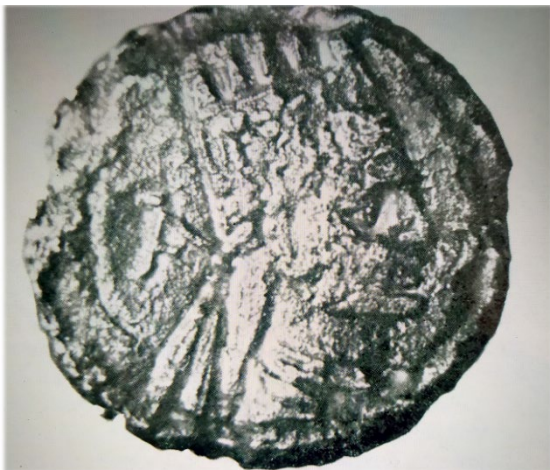
Արքայից Արքա Արտավազդ Բ

Հազվադեպ են վերջին Արտաշեսյան թագավորների դրամները, որոնք նշանակալից տարածում չեն գտել ոչ արտաքին առևտրում, և ոչ էլ Հայաստանի ներսում: Քանի որ մեծ մասամբ դրամները պղնձյա էին, դրանք օտար շուկաներում չէին ընդունվում, իսկ ներքին շուկայում նրանց օգտագործումը պարզելու վկայություններ չկան: Ողջ Անդրկովկասում Արտաշես Բ, Տիգրան Գ, Տիգրան Դ, Արտավազդ Դ, և դրանց հաջորդած վերջին թագավորների դրամներ չեն հայտնաբերվել: Դրամագիտական ժողովածուներում Արտաշեսյան տոհմի վերջին արքաներին վերագրված դրամները ներկայացված են հատ ու կենտ նմուշներով: Սա ցույց է տալիս այդ դրամների աննշան դերը: