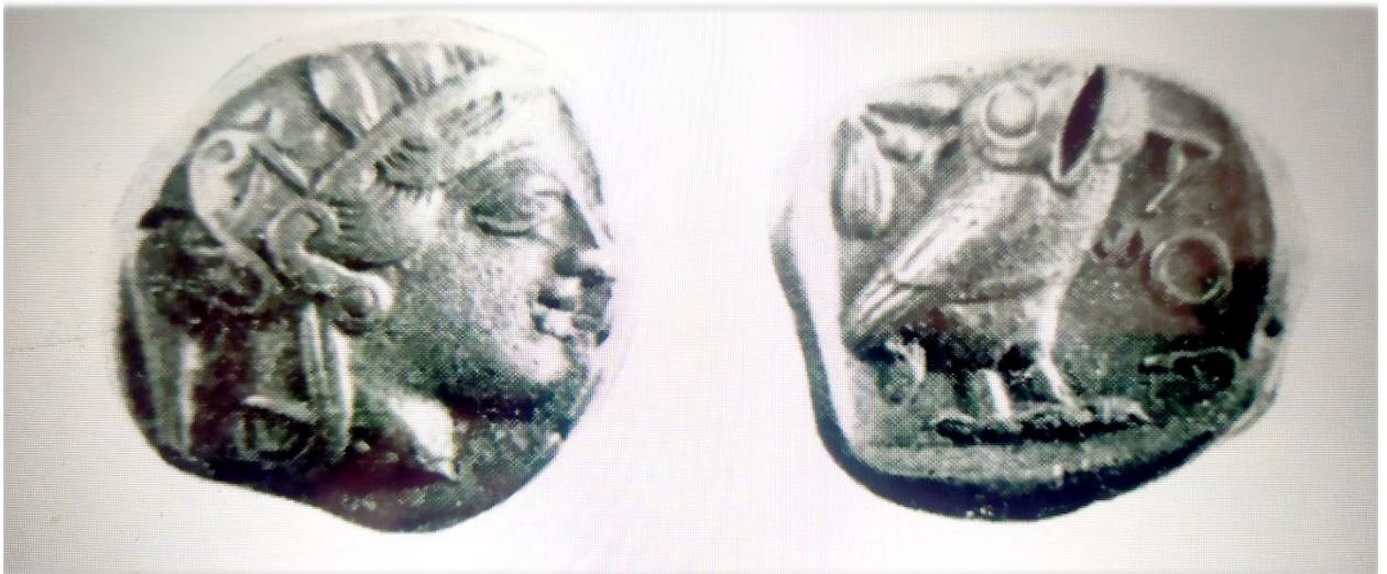
Հունական չորեք դրամ թողարկված Աթենքում մթա 6-5 դարերում: Գտնված Սիսիանում 1963թ.

Մինչև Քա. 4- րդ դարի վերջին տասնամյակը, երբ միջազգային առևտրում դեռ չէին երևացել Ալ. Մակեդոնացու դրամները, մեծ տարածում են ունեցել Աթենական տետրադրախմաները: Նման դրամներ են հայտնաբերվել Սիսիանում: Որքան էլ հետաքրքրական լինի այս դրամի հայտնությունը սակայն նրա դերի ու նշանակության մասին դատել հնարավոր չէ: