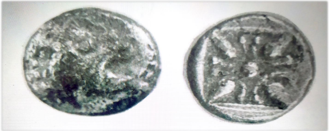
Հունական արծաթե դրամ թողարկված Քա (մթա)6-5-րդ դդ Մելիտոս քաղաքում

Մինչև Քա. 4- րդ դարի վերջին տասնամյակը, երբ միջազգային առևտրում դեռ չէին երևացել Ալ. Մակեդոնացու դրամները, մեծ տարածում են ունեցել Աթենական տետրադրախմաները: Նման դրամներ են հայտնաբերվել Սիսիանում: Որքան էլ հետաքրքրական լինի այս դրամի հայտնությունը սակայն նրա դերի ու նշանակության մասին դատել հնարավոր չէ: