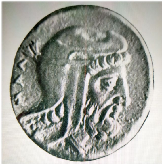
Աքեմենյան փոխարքա Տիրիբազոսի դիմաքանդակը մթա 4-րդ դարում

Կշռային տվյալներով դրանք պատկանում են, աքեմենյան համակարգին և թողարկված են Բացառապես արծաթից, դրանք մեծ մասամբ դրախմաներ են, և փոքր արժեչափի միավորներ՝ օբոլոսներ: Այս դրամները շրջանառության մեջ են եղել Կիլիկիայի, Փոքր Ասիայի և Միջագետքի տարանցիկ առևտրի համար: Բացի վերոհիշյալ դրամից Տիրիբազը թողարկել է նաև դրամներ Մալլոս քաղաքում Բ.Ա. 4-րդ դար 1 :