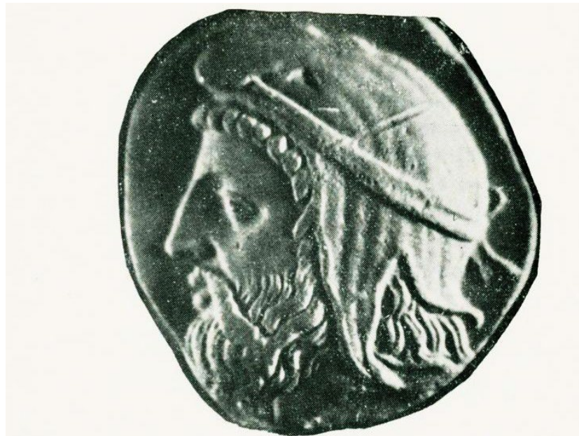
Հայաստանի Աեմենեսան փոխարեպ Օրոնտեսի դիմա- բանդակը, մ. թ. ա. 4րդ դար, ոսկեպ դրամի վրայ: Մեծացուած 3.5 անգամ

Օրոնտեսի դրամները ոչ իրենց ծագման, ոչ էլ շրջանառության առումով Հայաստանի դրամային տնտեսության հետ չեն առընչվում: Քանի որ նրա դրամները թողարկվել են Փոքր Ասիայում, բնորոշ են այդ վայրերի համար: Ք.Ա. 4րդ դարի 60ական թվականներին թողարկվում է ոսկե դրամ Օրոնտեսի պատկերով: Այս դրամը արքայից արքային հակադրվելու մի ցույց էր, որովհետև արքիմենյան կայսրության ոսկյա դրամ կարող էր թողարկել միայն գերագույն տիրակալը: Դրամի վրա հստակությամբ պահպանված է Օրոնտեսի դիմանկարը, որը հայերի մեջ հայտնի է Երվանդ Ե անունով: