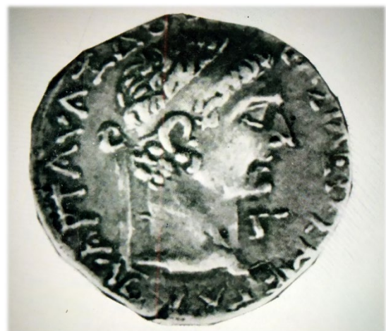
Արտավազդ Դ-ի դիմաքանդակը 4-6դդ