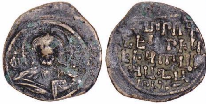
Կյուրիկե Բ-ի հատած դրամները

Մեզ հայտնի է նաև, որ XII-XIII դարերում Հայաստանում հաստատված Զաքարյանները նույնպես սեփական դրամ չեն թողարկել, և նրանք էլ Բագրատունի արքաների քաղաքականությանը հետևելով կիրառել են օտար դրամներ այդ թվում ևս Աղթալայում հատված վրացական դրամները: