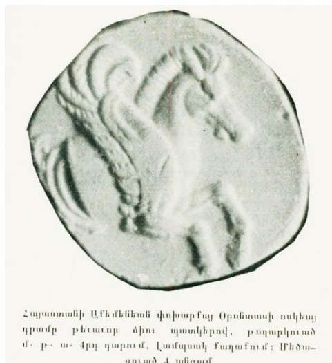
Հայաստանի Աեմենեան փոխարքայ Օրոնտեսի ոսկեայ դրամը քեատոր ձիու պատկերով, թողարկուած մ. թ. ա. 4րդ դարում, Լամպսակ քաղաքում: Աեմագուած 4 սնգամ

Շուրջը հազիվ նշմարելի պահպանվել են OPONTA հունարեն գիրը որոնցով հիշատակված է Օրոնտեսի անունը 1 : Դրամը պահպանվում է Փարիզում, Ֆրանսիայի ազգային մատենադարանում: