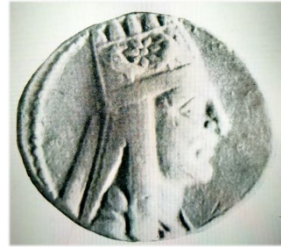
Հայոց «Արքայից Արքա» Տիգրան Մեծ (մթա 95-56թթ)

Տիգրան Մեծի հաջորդների օրոք կրճատվում է հայկական դրամների թողարկումը և թուլանում է նրանց դերն ու նշանակությունը միջազգային առևտրում: Արտավազդ Բ (Ք. ա. 56-34 թթ) դրամները քիչ օրինակով են հայտնի: Արտաշեսյան արծաթյա դրամները թողարկվում էին միայն Հայաստանում: Կան դրամներ հատված պղնձից և հատված չորեքդրամ, հնարավոր է, որ չորեքդրամը հատվել է Արտաշատում: Աջ կողմում հայկական խոյն է, ձախում ընթացող քառակի կառք, իսկ տիտղոսն է «Արքայից Արքա» Արտավազդ: Արտաշես Բ-ի (Ք. ա. 30-20) հատած պղնձյա դրամները տարբերվում էին մյուս՝ Տիգրանյան դրամներից: Հայտնաբերված դրամի 1-ին կողմը նորից հայկական խոյն էր, իսկ 2-րդը մարդու պատկեր է, տարբերվում է նաև տառերի գրելաձևը: Չնայած որ թագավորի անունը հնարավոր չի եղել կարդալ, բայց դրամագետները այն վերագրել են Արտաշես Բ-ին: Տիգրան Գ (Ք. ա. 20-8/9) հատել է պղնձյա դրամներ, որի առաջին կողմը նմանվում է արծաթի: Հայկական խոյը դաջված է հինգ երկայն ծոպերով և խոշոր ութաստամյան աստղով, առանց ոսկյա արծիվների: Պղնձյա դրամի վրա թագավորն անմորուս է: