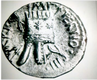
Հայոց Արտաշեսյան թագը

Արևմուտքի ու արևելքի Հելլենիստական միապետներից ոչ մեկը այդպիսի թագով հանդես չէր եկել: Իբրև արքայական գերագույն զարդարանք այն ստեղծվել է Արտաշեսյանների օրոք և հայտնի դառնալով անվանվել է «Հայկական թագ» 1 : «Արքայից Արքա» Տիգրանի կառավարման տարիների դրամների վրա առաջին անգամ պատկերվել է երկիրն ու պետականությունը հովանավորող աստվածուհու կերպարը ներկայացվելով իբրև մայր դիցուհի: