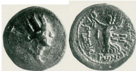
Մայրաքաղաք Արտաշատի դրամը, թողարկուած երկրորդ դարի վերջին: Մեծացուած 3 անգամ

Միջազգային առևտրի բերումով 2-րդ դարում Հայաստան են թափանցել նաև հունահռոմեական դրամներ հունարեն արձանագրություններով: Հռոմեական դրամների ընդհանուր հոսանքի հետ Հայաստան էին թափանցել նաև Հռոմին ենթակա Բոսֆորի թագավորության դրամները: 2-րդ դարի վերջին հայոց մայրաքաղաքի ներսում զարգացող ներքին առևտրի պահանջով առաջ էր եկել նաև պղնձյա դրամների տեղական թողարկումը քաղաքամայր Արտաշատի անունով: Արտաշատը հայտնի էր դարձել Փոքր Ասիայից և Միջագետքից դեպի կովկաս տանող քարավանային առևտրում: Ժամանակագրական առումով Արտաշատ քաղաքի դրամները ծագել են 183 թ: Դրամի թողարկում կատարվել է Արշակունի Վաղարշ Բ-ի թագավորության տարիներին: Մինչ այդ ոչ Արտաշեսյանների, և ոչ էլ Արշակունիների օրոք Հայաստանի որևէ քաղաքի անունից դրամներ չեն թողարկվել: Արտաշատում հատված դրամները իրենց պատվերագրությամբ պահպանել էին հելլենիստական դարաշրջանին բնորոշ տվյալները: Դրանք ունեին դիցաբանական պատկերներով նկարներ: Արտաշատի դրամը ներկայացնում է ժամանակը առանց միջնորդության և վերաբերում է 2-րդ դարի վերջին քաղաքական կյանքի պատմությանը: Մեզ հայտնի չէ, թե մինչև երբ է տևել քաղաքային այդ դրամների թողարկումը Արտաշատում: Քանի որ այս դրամները պղնձյա էին, արտաքին առևտրում կիրառելի չէին և շրջանառության ներքին ոլորտից դուրս չէին կարող գալ: