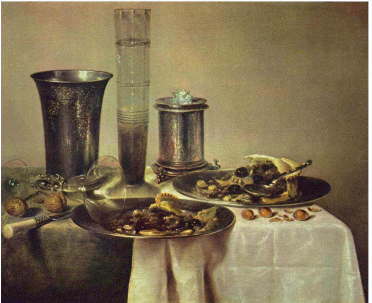
Վինսենտ Կլաս Զեդա, Նատյուրմորտ, 1637

Ժանրի զարգացմանը նպաստել են նաև XX դարի նկարիչները՝ Պաբլո Պիկասսոն (Ֆրանսիա), Ջորջո Մորանդին (Իտալիա), Դավիդ Սիկեյրոսը (Մեքսիկա), Կուզմա Պետրով-Վոդկինը (Ռուսաստան) և ուրիշներ