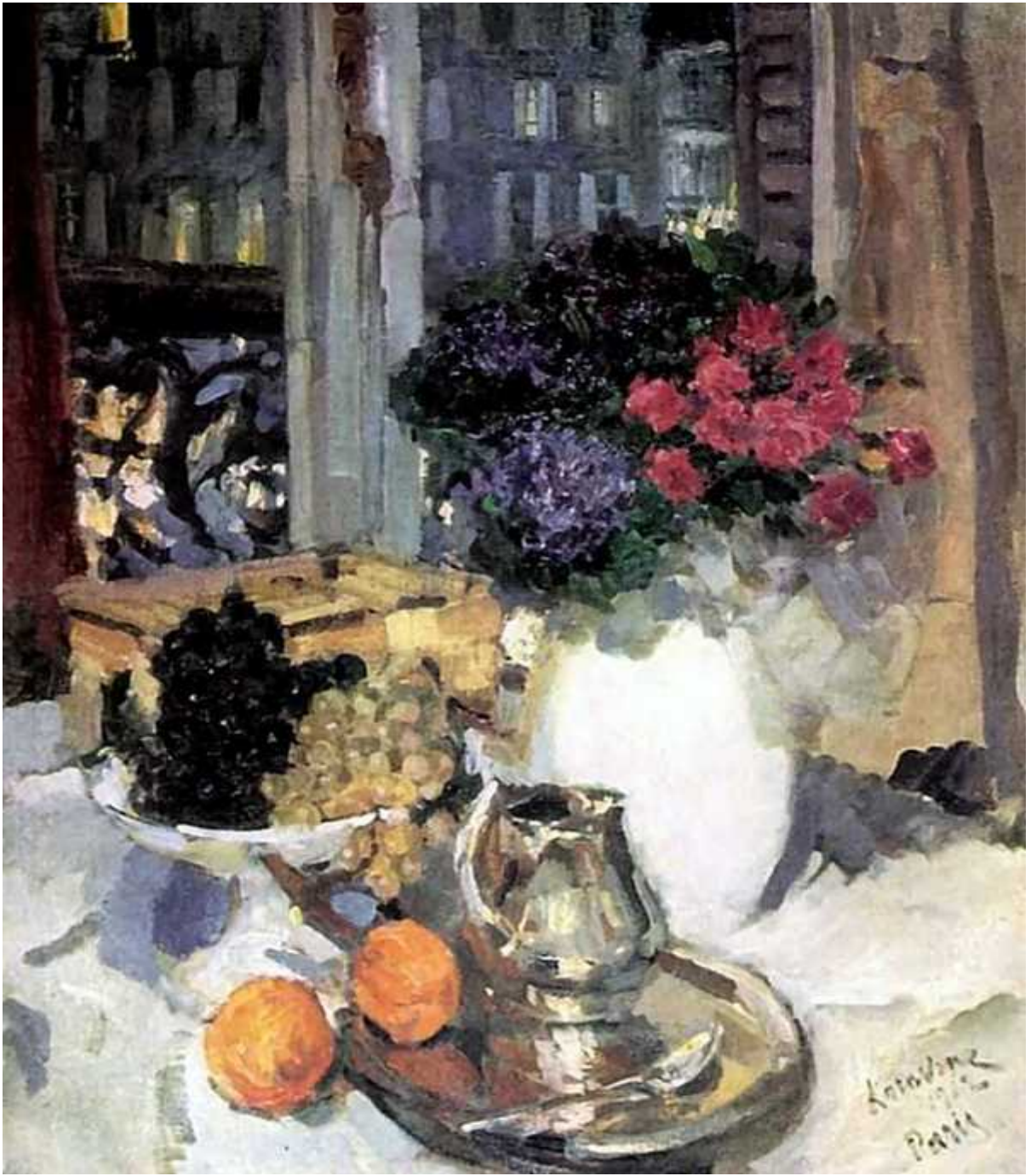
Կոնստանտին Ալեքսեևիչ Կորովին