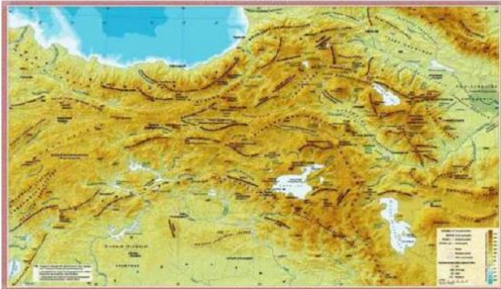
Հավելված 2. Հայկական լեռնաշխարհը և Առաջավոր Ասիան: Ք.Ա. III-II հազարամյակներում Հայկական առաջին պետական կազմավորումները: