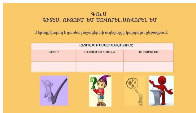
Նկ. 2 ԳՈՒՍ

Կան մեթոդներ, որոնց օգնությամբ կարելի է աշակերտների հետաքրքրասիրությունը կայուն պահել: Օրինակ Սասունցի Դավթի կոնիվը տեքստի վրա աշխատելիս կարելի է օգտագործել փոխգործուն գրառումների համակարգ՝ արդյունավետ ընթերցանության և մտածողության համար մեթոդը: Տեքստը լուռ ընթերցելիս աշակերտը մատիտով նշումներ է կատարում այն հատվածների կողքին, որոնց մասին գիտի / + նշանով / և այն հատվածների կողքին, որոնց մասին չգիտի / - նշանով /: