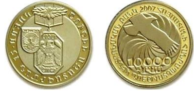
«Շուշիի ազատագրման 15-ամյակ» հուշադրամ

Արցախյան պատերազմի առանցքային իրադարձություններից է Շուշիի ազատագրումը: Հայկական ուժերը Կոմակոյուսի գնդապետ Արկաղի Տեր-Թադևոսյանի գլխավորությամբ 1992թ. մայիսի 9-ին ազատագրեցին Շուշին, որը արմատական բեկում էր արցախյան պատերազմում: