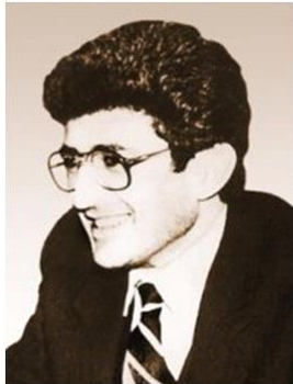
Արթուր Մկրտչյան (1959–1992 թթ.)

Լ.ՂՀ ԳԽ առաջին նախագահ ընտրվեց Արթուր Մկրտչյանը :