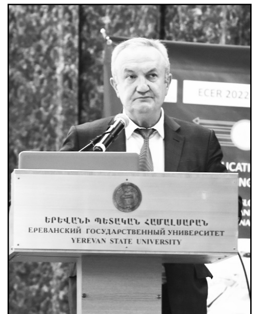
ների հետազոտողների հետ», - ասել է ԵՊՀ ռեկտորը եւ հավելել, որ համաժողովը մեկտեղում է ավելի քան 2.000 պատվիրակների աշխարհի 43 երկրից եւ համարվում է ոլորտի կարեւորագույն իրադարձություններից:

«Ողջունում են համաժողովի բոլոր մասնակիցներին Երեւանի պետական համալսարանում: Սա իր տեսակի մեջ եզակի եւ ամենամեծ իրադարձությունն է կրթական հետազոտությունների ոլորտում, որը համախմբում է կրթական հաստատություններին, հետազոտական ընկերություններին եւ կրթական փորձագետներին տարբեր երկրներից: Կրթության ոլորտի վերաբերյալ տարբեր հետազոտություններ կներկայացվեն եւ կքննարկվեն մասնագետների, կրթության փորձագետների, ինչպես նաեւ տարբեր հետազոտական հաստատություն-