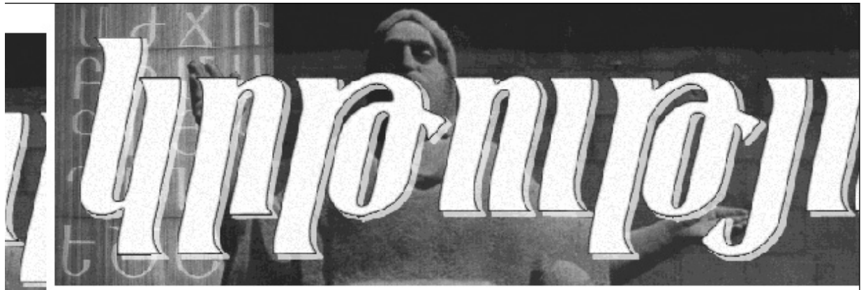
Շաբաթաթերթ «Krtutun» (education) weekly «КрТутун» (образование) еженедельник 12.10.200

Այլ մանրամասնությունների համար կարող եք դիմել «Հայփոստի» (51-45-47), «Հայմամուլի» (45-82-00) եւ այլ գործակալությունների այն մասնաճյուղերին, որտեղ կատարում եք բաժանորդագրությունը: