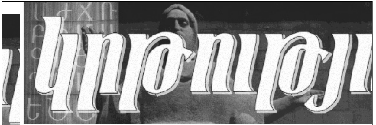
Շաբաթաթերթ «Krtutun» (education) weekly «КрТУТУН» (образование) еженедельник 12.10.200

Այլ մանրամասնությունների համար կարող եք դիմել «Հայփոստի» (51-45-47), «Հայմամուլի» (45-82-00) եւ այլ գործակալությունների այն մասնաճյուղերին, որտեղ կատարում եք բաժանորդագրությունը: