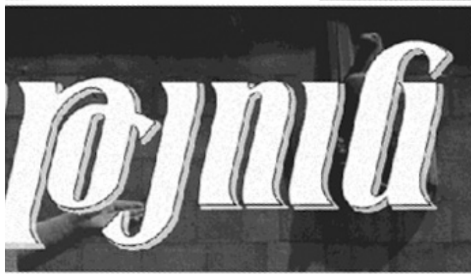
«КрТУТУН» еженедельник 05.10.2005թ. չորեքշաբթի թիվ 28 (175)

Քանի՞ դար կա այս անցումների միջին... Նախիջեւան-Երեւան-Իջեւան... Ե՛րբ է Նոյն անցել այս ուղերթով...