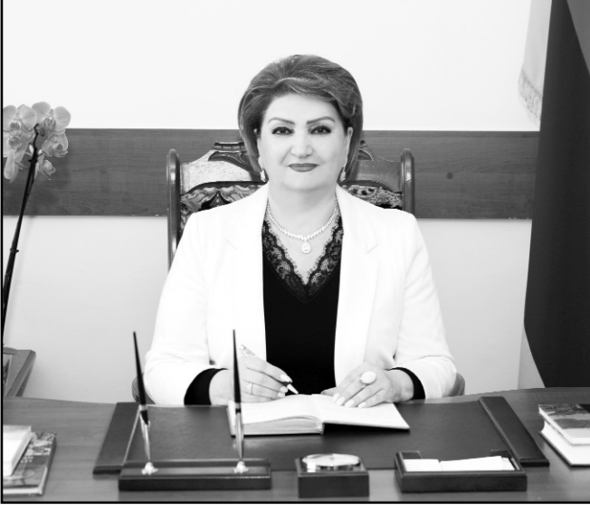
Երեւանի Գաղութային Գյուլժենկյանի անվան հ. 190 ավագ դպրոցի մանկավարժական կոլեկտիվ

Արկին շնորհաւորելով մեր սիրելի տնօրենին՝ մաղթում ենք երա կազառողղոյուն եւ գործունեոյուն երգանքի շարունակոյուն: