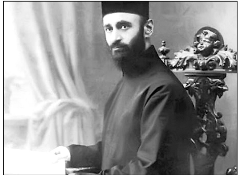
Կոմիտաս (Սողոմոն Գեւորգի Սողոմոնյան)

Նույն թվականին Կոմիտասը վերադառնում է Էջմիածին եւ շարունակում իր ազգագրագետ-կոմպոզիտորի, խմբավարի անկում եւ բազմաշնորհ աշխատանքը: Այս տարիներին Կոմիտասի ղեկավարած ճեմարանի երգչախումբը հասնում է փայլուն գեղարվեստական-կատարողական արդյունքների, ծավալում է համերգային մեծ գործունեություն: Գեւորգյան ճեմարանի երգչախումբը Կոմի-