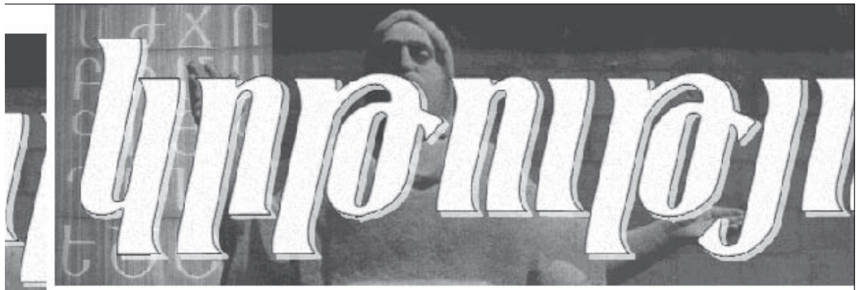
Շաբաթաթերթ «Krtutun» (education) weekly «Кртутун» (образование) еженедельник 12.10.2000

Այլ մանրամասնությունների համար կարող եք դիմել «Հայփոստի» (51-45-47), «Հայմամուլի» (45-82-00) եւ այլ գործակալությունների այն մասնաճյուղերին, որտեղ կատարում եք բաժանորդագրությունը: