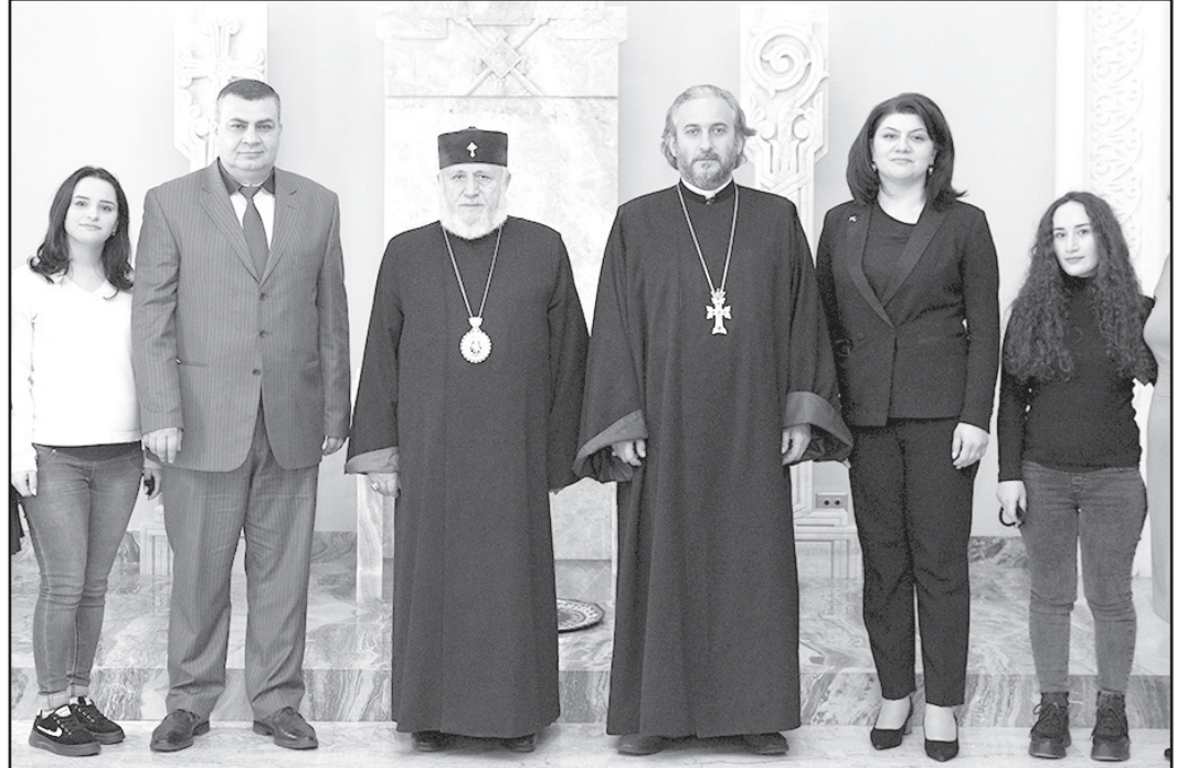
Նրանց կյանքից ներս:

Այնուհետև ներկայներին ողջունեց և իր հայրական օրհնությունը բերեց Ամենայն Հայոց Հայրապետը: Նորին Սրբությունն իր բերկրանքն արտահայտեց առ այն, որ հանդիպմանը ներկա են զավակներ սպասող շրջանավարտները՝ մաղթելով Աստծու ամենախնամ Աջի մշտական ներկայությունը