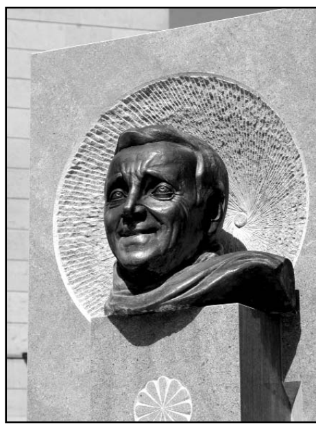
Կոզնեն ժողովրդին դիմակայել պատերազմի հետևանքներին», - ասված է Նիկոլա Ազնավուրի շնորհակալագրում:

«Ազնավուր» հիմնադրամը 2020-ի սեպտեմբերից մասնակցել է Արցախին և պատերազմից տուժած բնակիչներին նվիրված մարդասիրական առաքելությանը, ինչը կաներ ինքը՝ Շառլ Ազնավուրը: Ներկայումս մենք շարունակում ենք իրականացնել նախագծեր, որոնք